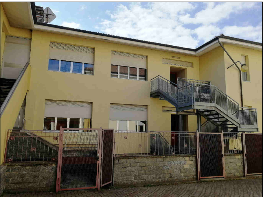
VISTA 1 DAL CORTILE